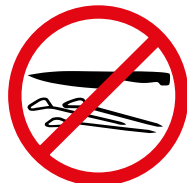
Gefährliche Gegenstände Dangerous objects