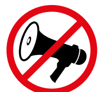
Mechanische oder elektrisch betriebene Lärminstrumente, Druckluft / Mechanical or electronic noisemakers, air horns