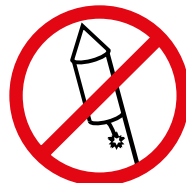
Raketen, Leuchtkugeln, Wunderkerzen, Bengalische Feuer, Rauchpulver, explosive Gegenstände Rockets, flares, sparklers, Bengali fireworks, smoking powder, explosive objects