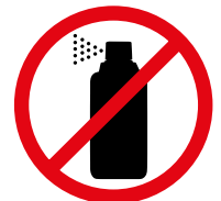
Gassprühdosen Gas spray cans