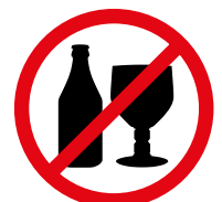
Glas-, Metallbehälter oder Flaschen - Alkoholische oder nicht alkoholische Getränke Glass, metal containers or bottles, alcoholic or non-alcoholic beverages