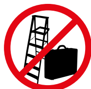
Koffer, Kisten, Stühle, Hocker, Leitern Cases, crates, chairs, stools, ladders