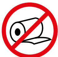
Papierrollen Paper streamers