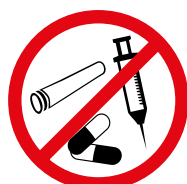
Drogen jeglicher Art Drugs of any kind