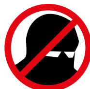
Vermummungsverbot Masks of any kind