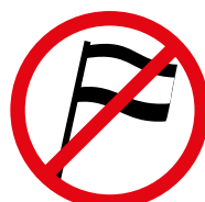
Fahnen oder Transparentstangen, die länger als 1,5 m oder deren Durchmesser größer als 3 cm sind. Flags or sign poles which are longer than 1.5 m or have a diameter of more than 3 cm.