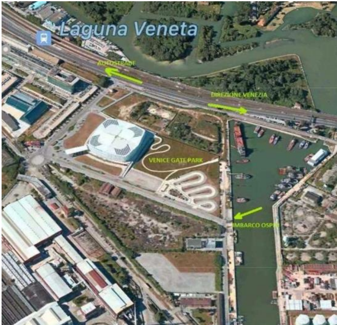
VENICE GATE PARKING - Via Galileo Ferraris

Tramite Autostrada A1 fino a Bologna poi in A13 Bologna - Padova e infine in A4 Padova - Venezia.